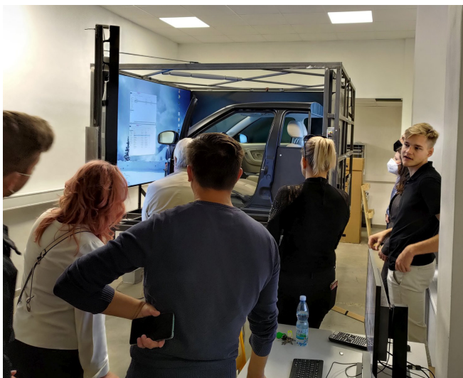
OPS Hospodářství, věda a vzdělávání, simulátor, 21.09.2021, Děčín