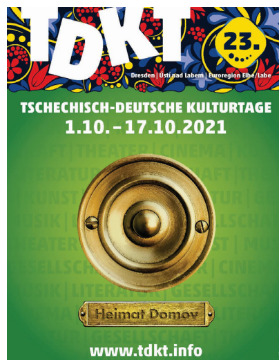
Motiv plakátu 23. Dnů české a německé kultury

Festival se konal od 1. do 17. října 2021 pod heslem "Domov". V návaznosti na předchozí ročník bylo cílem opět zaměřit se na otázky identity, historie, menšin a nejen regionální lokalizace, ale také například na otázky politického, historického, sociálního nebo uměleckého prostoru.