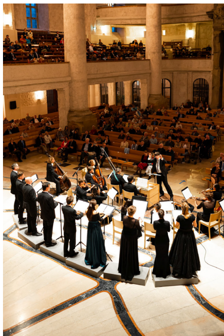
Zahájení 23. DČNK v kostele Kreuzkirche v Drážďanech

Pandemie se nevyhnula ani 23. Dnům české a německé kultury (DČNK). Přestože z tohoto důvodu nemusely být žádné akce zrušeny, vedla ochranná opatření na jedné straně ke snížení kapacity v místech konání akcí a na druhé straně k občasným dlouhým frontám u vchodů.