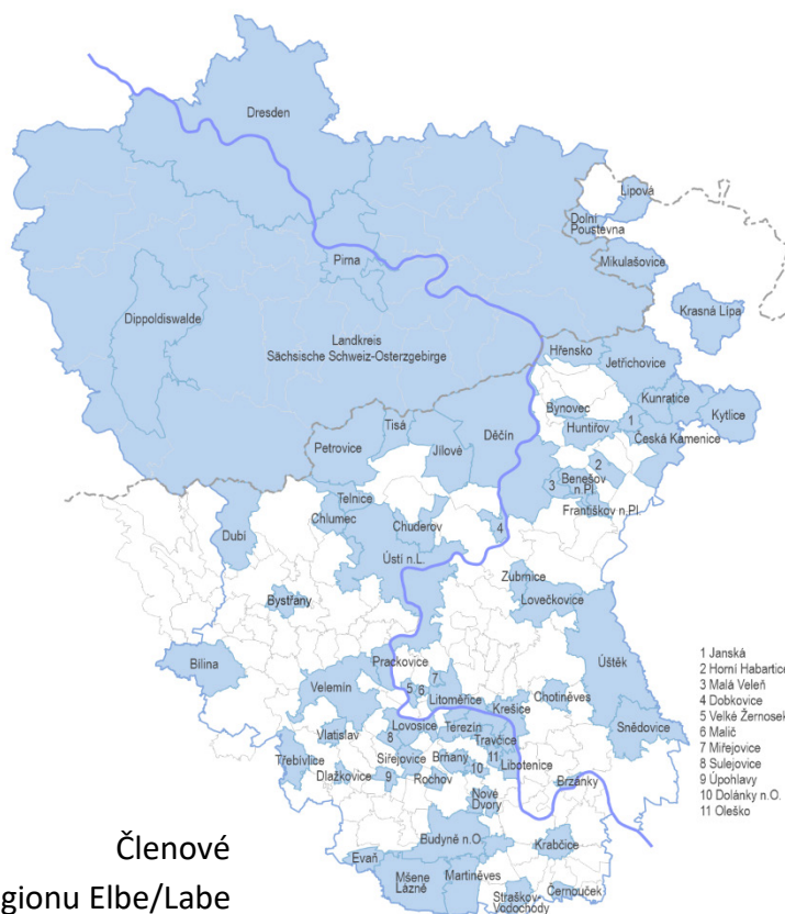
Členové Euroregionu Elbe/Labe