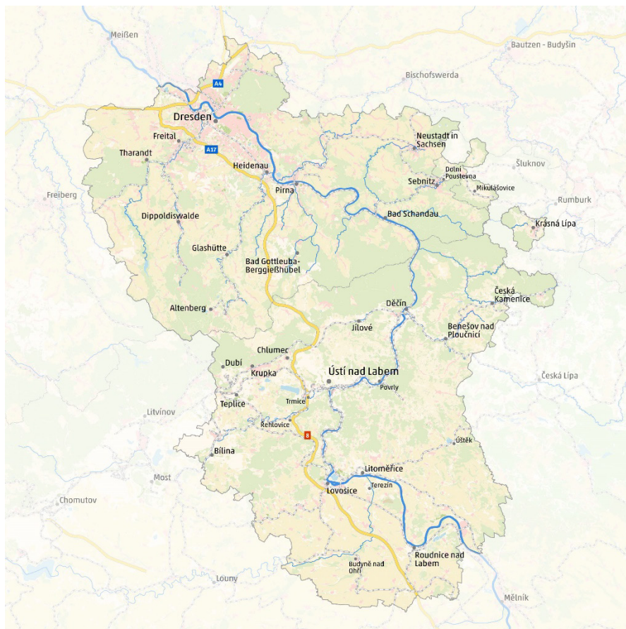
Území Euroregionu Elbe/Labe