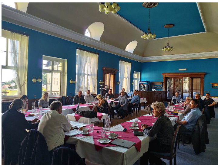
Zasedání Rady EEL dne 09.09.2021, Tereziны lazň v Dubí

Rada Euroregionu Elbe/Labe se sešla na svém výročním zasedání dne 9. září 2021 v Tereziých lázních v Dubí. Kromě zprávy o činnosti za uplynulých 12 měsíců a výhledu na nadcházející práci bylo nutné rozhodnout o administraci příštího Fondu malých projektů. Podle požadavků Komise EU může být FMP v budoucnu spravován pouze jedním subjektem, nikoli dvěma, jak tomu bylo dříve v rámci projektu spolupráce. Na rozdíl od ostatních sasko-českých euroregionů bylo rozhodnuto o převedení administrace FMP na českou stranu.