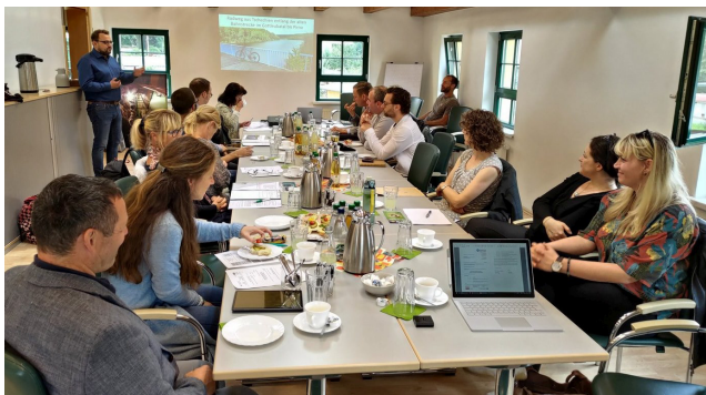
OPS Kultura a CR, 07.09.2021 v Bad Gottleubě-Berggießhübelu