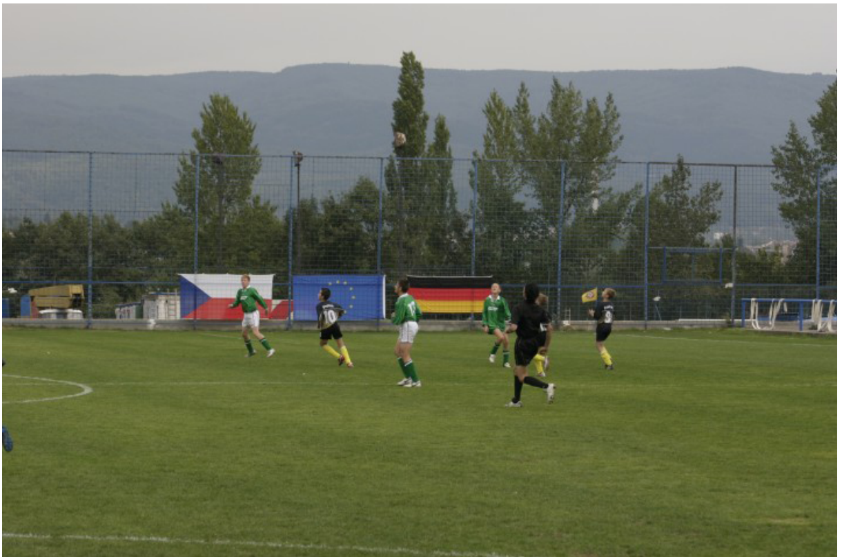
Kinder- und Jugendsportolympiade der EUROREGION ELBE/LABE