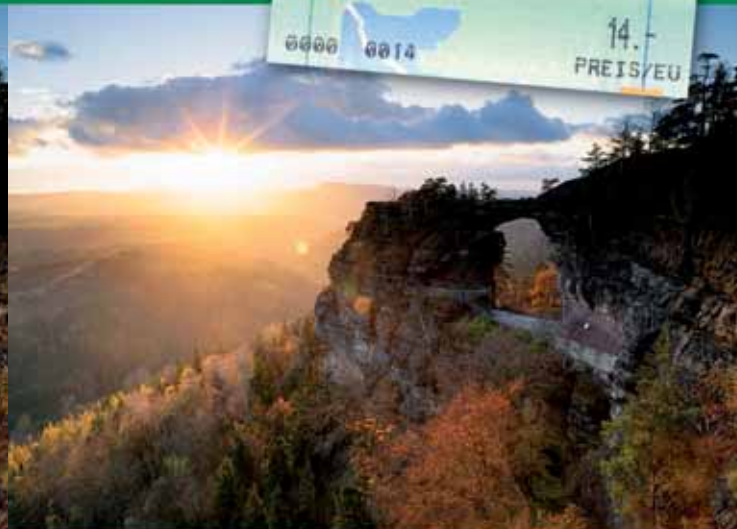
Pravčická brána