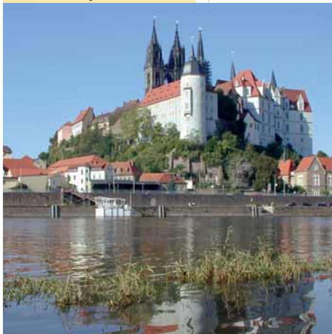
Albrechtsburg und Dom in Meißen / Hrad Albrechtsburg s chrámem v Míšni

Die Tour beginnt an der S-Bahn Station Meißen und führt über die Obergasse, Hahnemannplatz, Fleischergasse in die Meißner Altstadt. In Meißen laden Sie eine Vielzahl an Gaststätten und Cafés ein – hervorzuheben sind das Restaurant Vincenz Richter am Markt und der Rabener Keller auf der Elbstraße. Unterhalb der Albrechtsburg über die Leipziger Straße, Meisastraße und Fischergasse in Richtung neue Elbbrücke weiter gehen. Nach der Brücke an der ersten Kreuzung nach links abbiegen. Ca. 100 m geradeaus und dann über die Katzenstufen nach oben zur Proschwitzer Straße mit herrlichem Blick auf Meißen. Weiter geradeaus, links führt Sie der Weg zum Schloss Proschwitz. Von Proschwitz aus über den Schulweg nach Winkwitz gehen. Nun talwärts zum Gasthaus Knorre und am Elberadweg zurück zur S-Bahn Station Meißen.