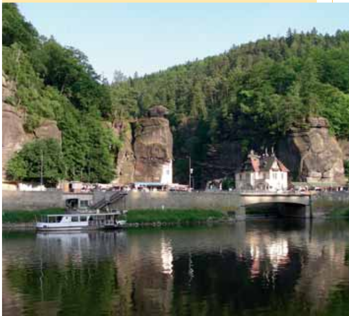
Grenzfähre Schöna - Hřensko / Hraníči přivoz Schöna - Hřensko

So können Sie schnell und bequem Herrnskretschchen (Hřensko) erobern, aber auch die Kamnitzklammen (Soutěský Kamenice), das imposante Prebischtor (Pravčická brána) oder die beeindruckenden Aussichtspunkte bei Dittersbach (Jetřichovice). Auf dem Rosenberg (Růžovský vrch) begegnen Sie seltenen Pflanzen wie dem neunblättrigen Zahnwurz oder dem Rippenfarn. In den Felsschluchten, den Bächen und Flüssen können Sie das Rufen des Eisvogels vernehmen, Spuren des Fischotters sehen, Flussforellen und Lachse erspähen. Auch Wanderfalke, Luchs und Uhu sind in der Böhmisches Schweiz zu Hause. In den Orten treffen Sie auf Friedenskreuze, Felskapellen und verlassene Kirchenwege sowie die Umgebendhäuser, die es nur noch hier und in der Oberlausitz gibt.