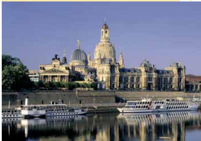
Dresden, Blick zur Altstadt / Drážďany, pohled na Staré město

Auf dieser Tour sehen Sie im Dresdner Zentrum viele Sehenswürdigkeiten – sowohl auf Altstädter als auch auf Neustädter Seite. Sie beginnen Ihre Tour am Postplatz und gehen in die Ostra-Allee hinein. Bereits nach wenigen Schritten stehen Sie vor dem Dresdner Zwinger. Diesen betreten Sie durch das Kronentor und gehen gegenüber liegend am Eingang zur Gemäldegalerie Alte Meister wieder hinaus. Links finden Sie die Semperoper und rechts die Katholische Hofkirche sowie das Residenzschloss. Zwischen Kirche und Schloss hindurch, gelangen Sie am Georgentor und Fürstenzug vorbei zum Neumarkt mit der Dresdner Frauenkirche. Vor der Frauenkirche biegen Sie links in die Münzgasse mit ihren vielen Gaststätten ein. Von hier gehen Sie über Treppen auf die Brühlische Terrasse hinauf. Links und dann über die Augustusbrücke gelangen Sie in die Neustadt. Am Goldenen Reiter beginnt die Hauptstraße. Diese verlassen Sie nach wenigen Metern und biegen links durch einen Durchgang in die Heinrichstraße ein. Schon befinden Sie sich in einem wunderschönen, vom Barock geprägten Viertel. Weiter führt Sie die Tour rechts in die Rähnitzgasse. An der Kreuzung mit dem Obergraben nach rechts ist es nur ein kurzer Abstecher zu den Kunsthändlerpassagen. Von der Rähnitzgasse gelangen Sie auf Dresdens exklusivste Einkaufsstraße, die Königstraße. Diese führt Sie schließlich zum Endpunkt der Tour, zum Albertplatz.