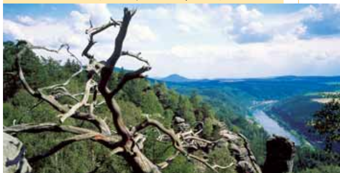
Sächsische Schweiz, Elbtal / Saské Švýcarsku, údolí Labe

Krönender Abschluss der Tour ist das Sächsische Elbland, wo die Sächsische Weinstraße mit ihren steilen Lagen hoch über saftig grünen Wiesen und romantischen Elbweindörfern als nordöstlichstes Weinanbaugebiet Deutschlands immer wieder alle Besucher beeindruckt. Die Stadt Radebeul bildet das Herzstück der Sächsischen Weinstraße und ist weithin als Wohnort des berühmten Winnetou-Schriftstellers Karl May bekannt. Außerdem fährt von Radebeul Ost täglich eine der ältesten Schmalspurbahnen Deutschlands, die Löbnitzgrundbahn, im Dampfbetrieb nach Moritzburg und weiter nach Radeburg. Schließlich erreichen wir die mehr als 1000-jährige Porzellan- und Weinstadt Meißen. Besonders die Meißen Altstadt mit ihren kleinen Gässchen und liebevoll restaurierten Häusern ist überaus sehenswert. Den besten und schönsten Blick haben die Besucher der historischen Stadt vom Meißen Burgberg mit Albrechtsburg und Dom.