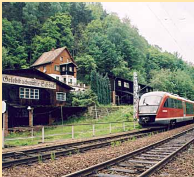
Wanderexpress Bohemica an der Gelobtbachmühle in Schöna / Turistickým expresem Bohemica u mlýna Gelobtbachmühle