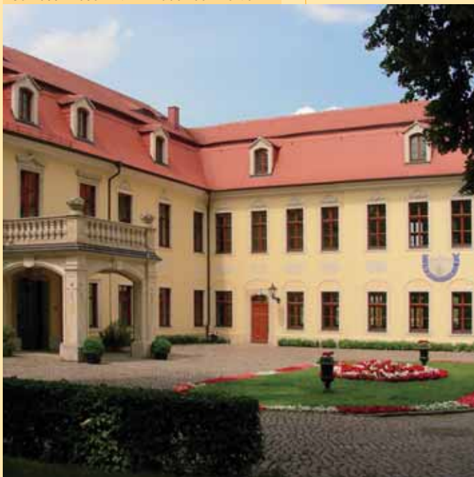
Zámek Proschwitz v Zadelu u Míšně / Schloss Proschwitz in Zadel bei Meißen

Trasa začíná u stanice rychlodráhy (S-Bahn) Míšeň a vede ulicemi Obergasse, Hahnemannplatz, Fleischergasse do Míšeňského starého města. V Míšni můžete navštívit řadu restaurací a kaváren – doporučit můžeme restauraci Vincenz Richter na náměstí a Rabener Keller v ulici Elbstraße. Pokračujte pod hradem Albrechtsburg ulicí Leipziger Straße, Meisastraße a Fischergasse směrem k novému mostu přes Labe. Za mostem odbočte na první křižovatce doleva. Pokračujte ca. 100 m rovně a pak po »Kočičích schodech« (Katzenstufen) nahoru na ulici Proschwitzer Straße s nádherným výhledem na Míšeň. Dále rovně, cesta doleva Vás zavede na zámek Proschwitz. Z Proschwitzu dojdete po cestě Schulweg do Winkwitzu. Odtud sejdete dolů k hostinci Knorre a po labské cyklostezce zpět ke stanici rychlodráhy Míšeň.