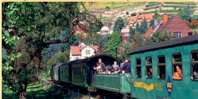
Úzkorozchodná dráha Löbnitzgrundbahn před vinicemi u Radebeulu / Löbnitzgrundbahn vor den Radebeuler Weinbergen

Přes Pirnu se středověkým náměstím, která se malebně rozkládá na březích Labe, pokračujete dál po proudu řeky do Drážďan, hlavního města země Sasko. V Drážďanech lákají k návštěvě známé a skvostné stavby, jako je galerie Zwinger, Residenční zámek či kostely Hofkirche a Frauenkirche. Semperova opera, Kreuzkirche, divadlo Komédie a mnoho menších scén nabízí prvotřídní kulturu pro každého. Široké bulváry a úzké uličky zvou k procházkám, nákupní galerie a obchodní domy k nákupům, restaurace, bary a hospody k posezení.