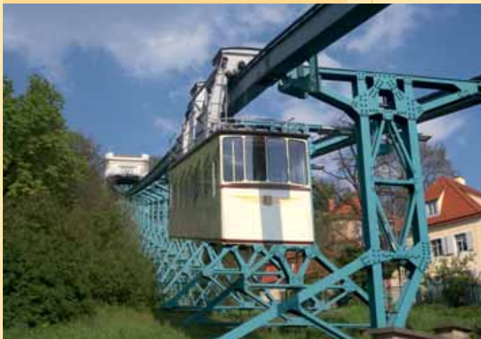
Drážďanská visutá dráha / Dresdner Schwebebahn

Na této trase poznáte mnoho památek v centru Drážďan – jak na straně Starého, tak i na straně Nového města. Vaše trasa začíná na náměstí Postplatz, odkud pokračujete do ulice Ostra-Allee. Již po několika krocích stojíte před Drážďanským Zwingerem. Do něj vejdete Korunní branou (Kronentor) a vyjdete protilehlým vstupem k obrazové galerii starých mistrů. Vlevo naleznete Semperovu operu a vpravo pak katolický kostel Hofkirche a Rezidenční zámek. Projďte mezi kostelem a zámekem a pokračujete kolem Georgentor a Fürstenzug na náměstí Neumarkt s kostelem Frauenkirche. Před Frauenkirche odbočíte doleva do ulice Münzgasse se spoustou restaurací. Odtud vystoupáte po schodech na Brühlskou terasu. Doleva a po Augustově mostu se dostanete do Nového města. U zlaté sochy Augusta Velikého Goldenere Reiter začíná hlavní ulice. Tu opustíte po několika metrech, kdy odbočíte doleva a projдете průchodem do ulice Heinrichstraße. A tady se již nacházíte v nádherné barokní čtvrti. Trasa dále pokračuje doprava do uličky Rähnitzgasse. Na křižovatce s Obergraben se dejte doprava a odtud už je to jen kousek k baroknímu komplexu s pasážemi s obchůdky uměleckých řemeslníků (Kunsthändlerpassagen). Z uličky Rähnitzgasse se dostanete na nejexkluzivnější drážďanskou nákupní ulici, Königstraße. Ta vás dovede na konec trasy, na náměstí Albertplatz.